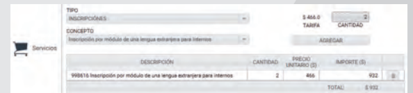
*muestra de formato único de pago para la contratación de idiomas